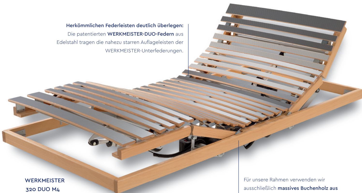
WERKMEISTER 320 DUO M4

Die patentierten WERKMEISTER-DUO-Federn aus Edelstahl tragen die nahezu starren Auflageleisten der WERKMEISTER-Unterfederungen.